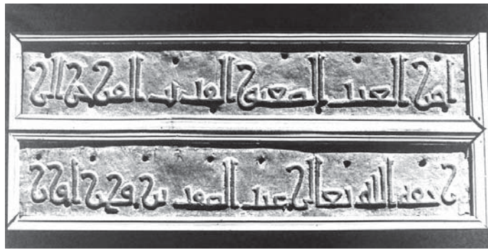
لوح کتیبه‌دار متعلق به آستانه حضرت عبدالعظیم (منبع: هدایتی، آستانه ری، ص ۷۰)